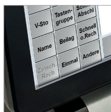
Rahmenloses Touchpanel, elegant, multitouchfähig, kratzfest und verschleißfrei