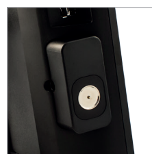
Integriertes Dallas Kellnerschloss (Option)