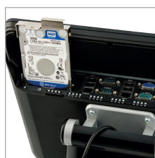
Einfach, schnell und werkzeu-frei im (Zu)griff: Massenspei-cher und Schnittstellen sind leicht erreichbar und im Servicefall schnell zu wechseln